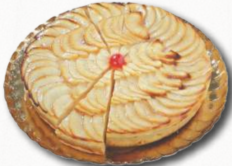
9055 TARTA DE MANZANA PORCIONADA Pasta brisa rellena de crema y manzanas seleccionadas. 12 porciones 1700 g. Ø28 cm. 8 cajas por base 168 cajas por palé