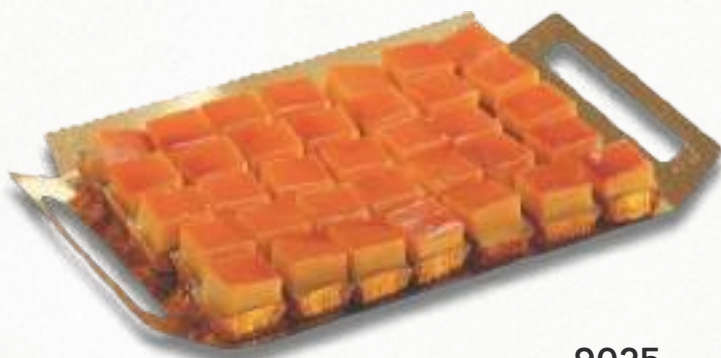
9025 MINITOCINILLOS DE CIELO 2 bandejas de 35 unidades. Peso aproximado 2x800 g. 8 cajas por base 168 cajas por palé