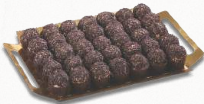
9024 TRUFITAS 2 bandejas de 35 unidades. Peso aproximado 2x750 g. 8 cajas por base 168 cajas por palé