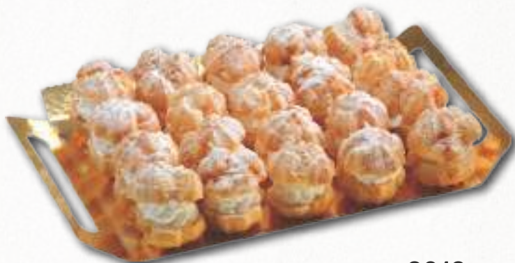
9016 BOCADITOS DE NATA 2 bandejas de 20 unidades. Peso aproximado 2x450 g. 8 cajas por base 168 cajas por palé