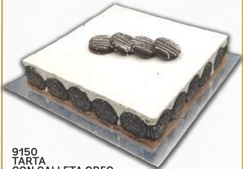
9150 TARTA CON GALLETA OREO Exquisito mousse de crema con auténticas galletas Oreo. 16 porciones 1650 g. 8 cajas por base 120 cajas por palé