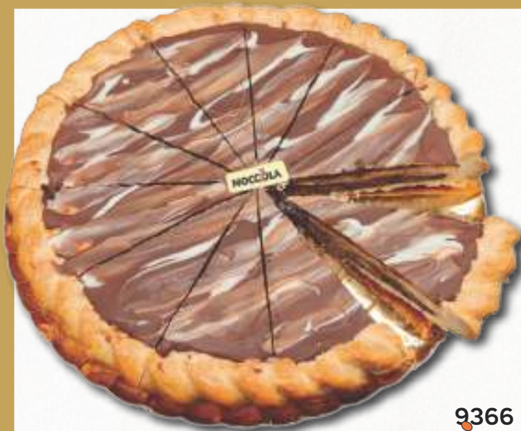
9366 PASTEL NOCCOLA PORCIONADO Típica especialidad local elaborada con hojaldre y crema de cacao, decorada con crema de cacao y avellana. 8 cajas por base 168 cajas por palé