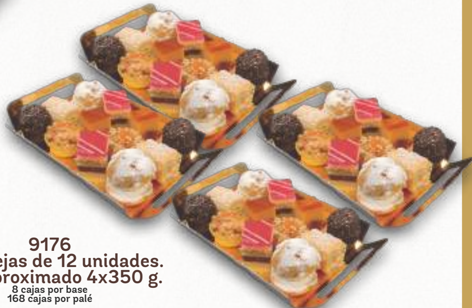
9176 4 bandejas de 12 unidades. Peso aproximado 4x350 g. 8 cajas por base 168 cajas por palé