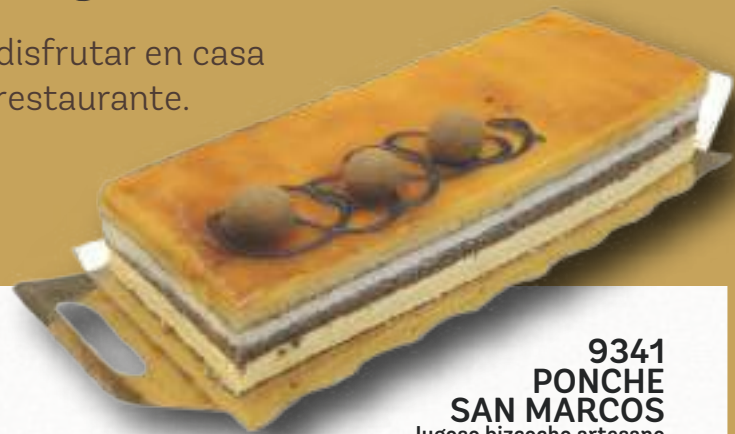
9341 PONCHE SAN MARCOS Jugoso bizcocho artesano emborrachado de anís, bizcocho de cacao, relleno con nata y crema con yema tostada. 7-8 porciones 2x800 g. 8 cajas por base 144 cajas por palé