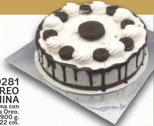
9281 TARTA CON GALLETA OREO BENJAMINA Exquisito mousse de crema con auténticas galletas Oreo. 8-9 porciones 900 g. Ø22 cm. 12 cajas por base 144 cajas por palé