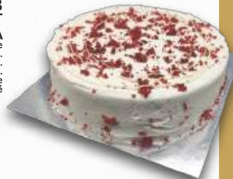
9328 TARTA RED VELVET BENJAMINA Bizcocho terciopelo y relleno de crema de queso. 8-9 porciones 900 g. Ø22 cm. 12 cajas por base 144 cajas por palé