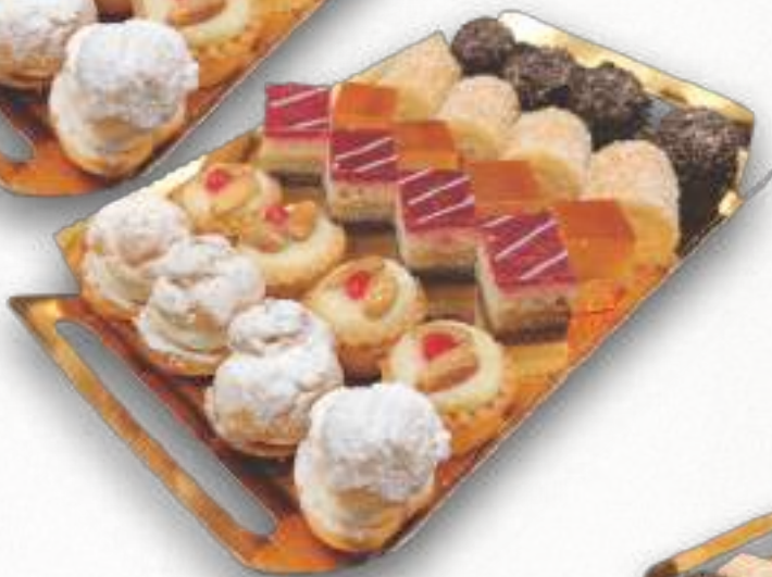
9011 2 bandejas de 24 unidades. Peso aproximado 2x700 g. 8 cajas por base 168 cajas por palé