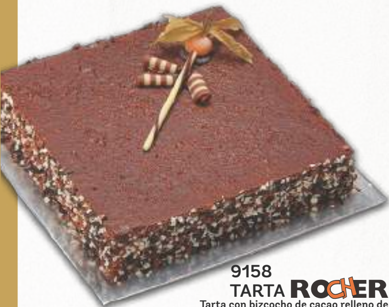
9158 TARTA ROCHER Tarta con bizcocho de cacao relleno de crujiente Rocher y mousse de chocolate al Rocher, canteada con paillete de tres chocolates y decorada con chocolate crujiente. 16 porciones 2000 g. 8 cajas por base 120 cajas por palé