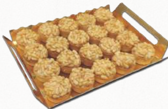
9030 MINITARTALETAS DE PIÑONES 2 bandejas de 20 unidades. Peso aproximado 2x750 g. 8 cajas por base 168 cajas por palé