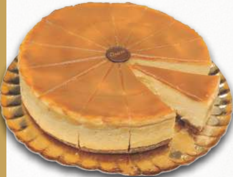
9059 TARTA QUESO CON DULCE DE LECHE PORCIONADA Exquisita masa de queso extracremoso con pasta brisa y dulce de leche. 14 porciones 2500 g. Ø26 cm. 8 cajas por base 120 cajas por palé