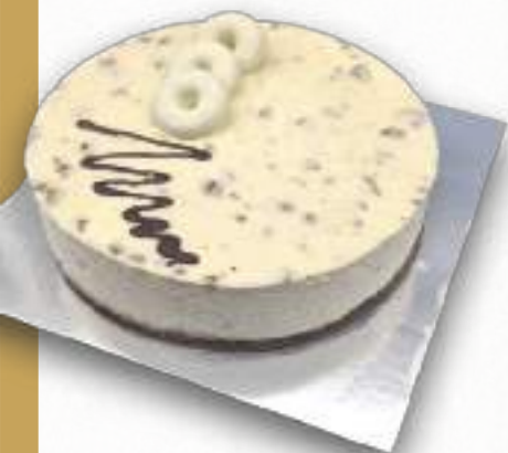
9323 TARTA FILIPINOS BENJAMINA Suave mousse de chocolate blanco con Filipinos, decorada con auténticos Filipinos. 8-9 porciones 800 g. Ø22 cm. 12 cajas por base 144 cajas por palé