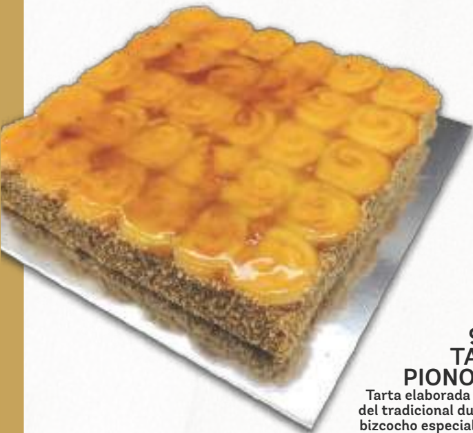
9194 TARTA PIONONOS Tarta elaborada a partir del tradicional dulce, con bizcocho especial, crema pastelera, yema tostada y perfume de anís. 16 porciones 2000 g. 8 cajas por base 120 cajas por palé