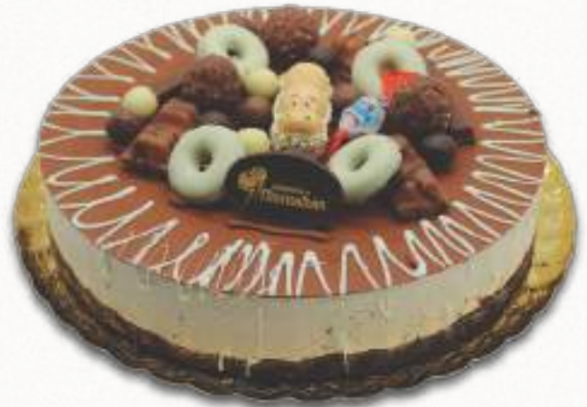
9279 TARTA KINDER Delicioso mousse de crema de avellana y chocolate con leche, sobre esponjosa base de bizcocho de chocolate, decorado con surtido de crujientes chocolatinas. 14 porciones 1650 g. Ø26 cm. 8 cajas por base 120 cajas por palé