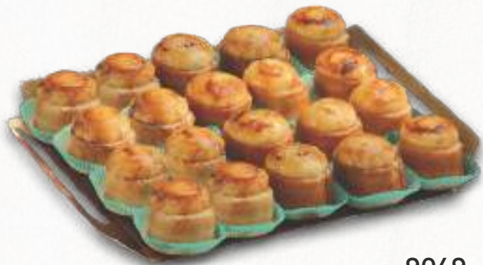
9049 MINIPIONONOS 2 bandejas de 20 unidades. Peso aproximado 2x800 g. 8 cajas por base 168 cajas por palé