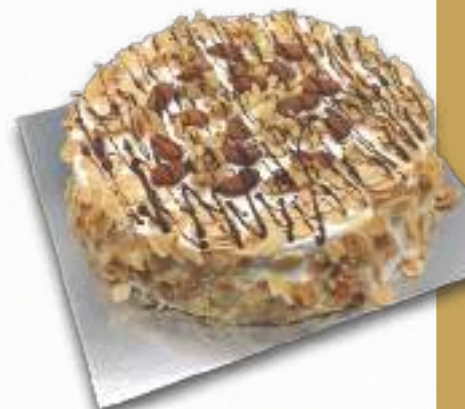
9202 TARTA SARA SIN AZÚCARES AÑADIDOS BENJAMINA Biscocho sin azúcar, nata montada sin azúcar y frutos secos. 8-9 porciones 900 g. Ø22 cm. 12 cajas por base 144 cajas por palé