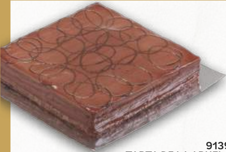
9139 TARTA DE LA ABUELA Tarta con galletas María, crema de flan, trufa cocida y bañada en chocolate con leche. 20 porciones 2500 g. 8 cajas por base 166 cajas por palé