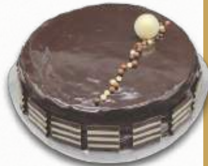
9188 TARTA MONCHER BENJAMINA Bizcocho de chocolate, crema de chocolate, crujiente Rocher y glaseado de chocolate. 8-9 porciones 950 g. Ø22 cm. 12 cajas por base 144 cajas por palé