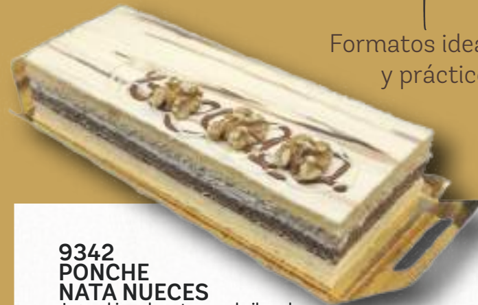
9342 PONCHE NATA NUECES Jugoso bizcocho artesano almibarado y bizcocho de cacao, relleno con mousse de nata, mousse de nueces y mousse de chocolate blanco. 7-8 porciones 2x800 g. 8 cajas por base 144 cajas por palé

Formatos ideal para disfrutar en casa y práctico en el restaurante.