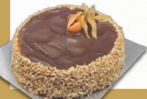
9203 TARTA CHOCO-YEMA SIN GLUTEN Y SIN LACTOSA BENJAMINA Bizcocho de harina de maíz, crema de yema de huevo y recubrimiento de glaseado de chocolate sin lactosa y granillo de almendra. 8-9 porciones 900 g. Ø22 cm. Con harina sin gluten y leche sin lactosa. 12 cajas por base 144 cajas por palé