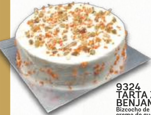
9324 TARTA ZANAHORIA BENJAMINA Bizcocho de zanahoria y cereales, crema de queso y nueces. 8-9 porciones 900 g. Ø22 cm. 12 cajas por base 144 cajas por palé