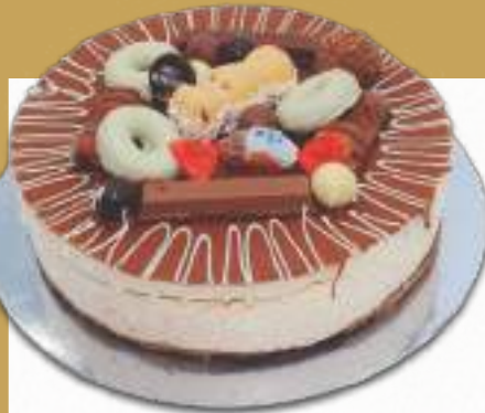
9280 TARTA KINDER BENJAMINA Delicioso mousse de crema de avellana y chocolate con leche, sobre esponjosa base de bizcocho de chocolate, decorado con surtido de crujientes chocolatinas. 8-9 porciones 900 g. Ø22 cm. 12 cajas por base 144 cajas por palé

Formatos de 8-9 porciones para disfrutar en casa, en cualquier momento.