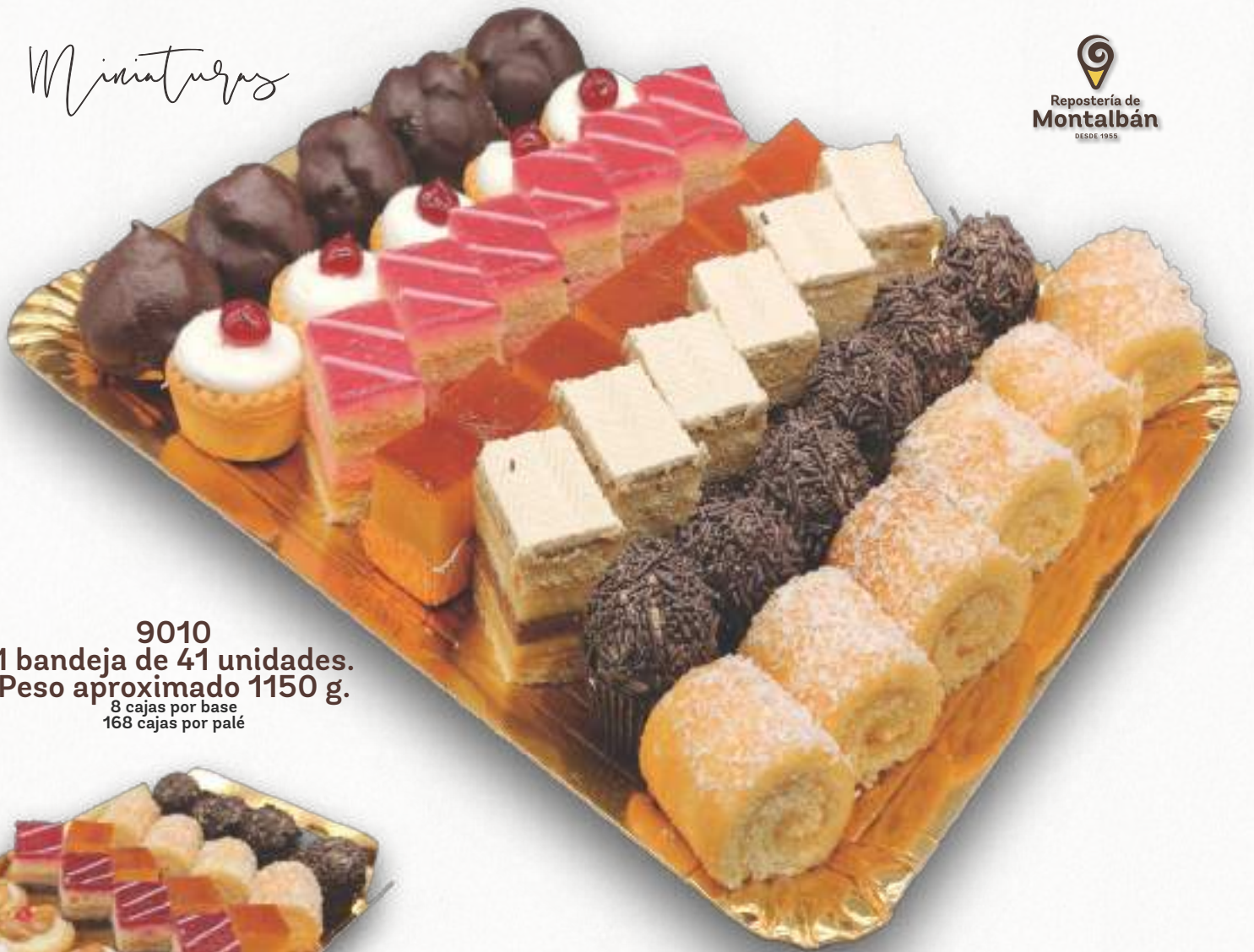
9010 1 bandeja de 41 unidades. Peso aproximado 1150 g. 8 cajas por base 168 cajas por palé