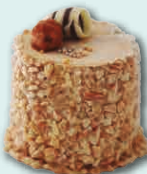
Crocantino Tradicional helado de vainilla y turrón. Canteado de crocanti. Decorado con nueces de Macadamia y viruta de chocolate. 130 ml. 14 unidades/caja.