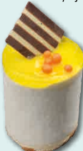
Delicia de Limón Refrescante helado de limón con corazón de limoncello. Decorado con crema de limón y bolitas de chocolate. 140 ml. 20 unidades/caja.