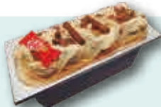
Hecho con Kit Kat