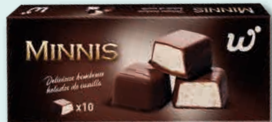
Bomboncito Helado Helado de vainilla y cubierta de chocolate. 10x20ml 32 estuches/caja