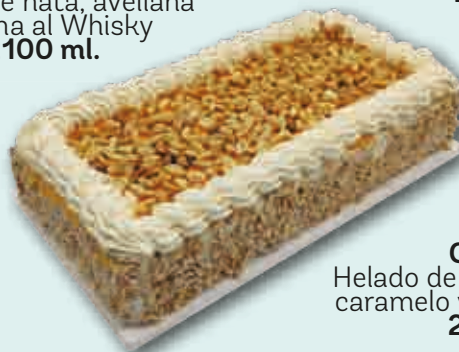
Carapino Helado de Nata con piñones caramelo y yema confitada. 2200 ml.