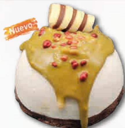
Iglú Chocolate Blanco con Pistacho Mousse de chocolate blanco con crema de pistacho. 150 ml. 12 unidades/caja.