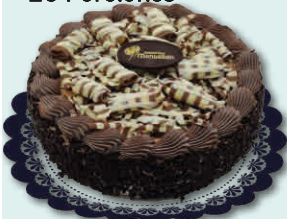
Tres Chocolates 2900ml.