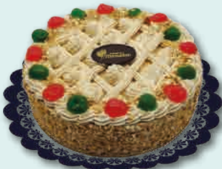
Turrón Suprema 2100 ml.