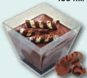
Chocolate Intenso 70%