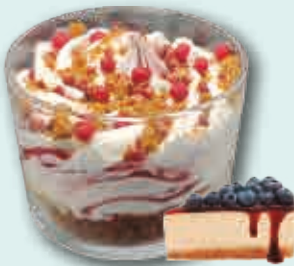
Tarta de Queso con arándanos