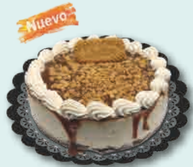
Galleta Speculoos 1500 ml.