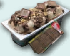
Hecho con Chocolate Jungly