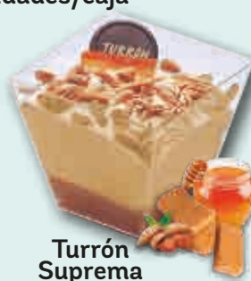
Turrón Suprema con Turrón