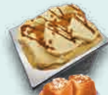
Caramelo Salado a la Vainilla