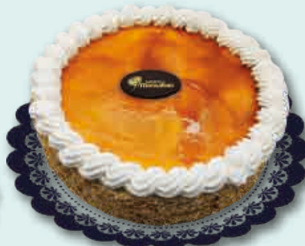
Yema al Whisky Helado de nata, avellana y Yema al Whisky 2100 ml.