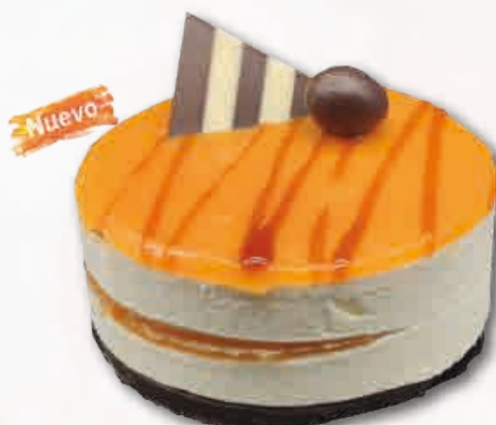
Tartín de Vainilla con Crema Brulée Mousse de vainilla con crema brulée 170 ml. 12 unidades/caja.