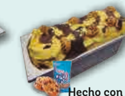
Hecho con Chips Ahoy