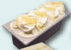
Hecho con Chocolate Blanco Mikybar