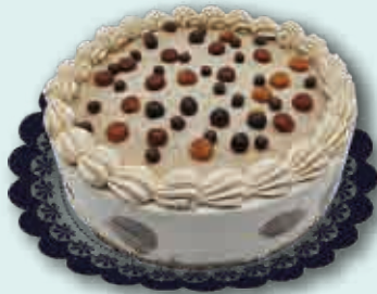
KINDER 1500 ml.