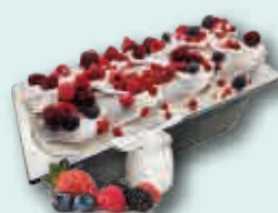
Yogurt con frutas del bosque