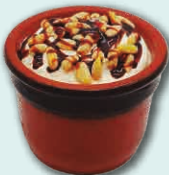
Flan Helado con Piñones 140 ml. 6 unidades/caja