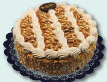
Nata Nueces con Toffee 2100 ml.