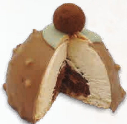
Iglú Latte Nocciola con Crujiente de Gianduja Semifrío con chocolate Kinder y corazón de bombon Rocher. 150 ml. 12 unidades/caja.