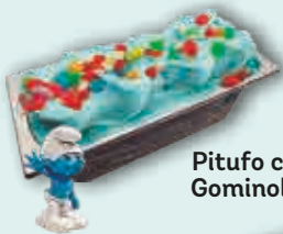
Pitufo con Gominolas