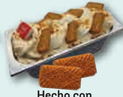
Hecho con Galleta Lotus