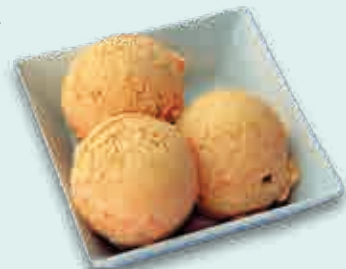
Bolas Artesanas Turrón

Consiga versatilidad en sus postres, ofreciendo calidad, variedad y sencillez.