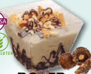
ROCHER Sin Gluten Sin Lactosa