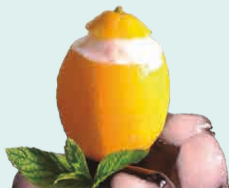
Limón Helado 140 ml. 6 unidades/caja