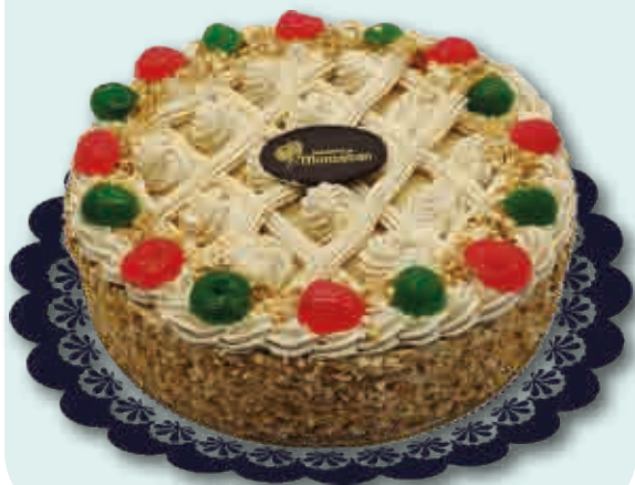
Turrón Suprema 2900 ml.