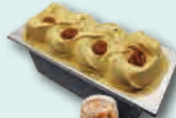
Dulce de Leche