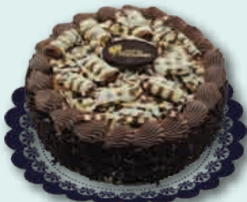
Tres Chocolates 1600 ml.