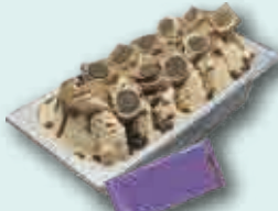
Hecho con Chocolate Milka Oreo