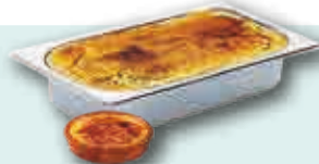
Crema Catalana 5l.