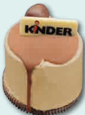
KINDER Delice Helado de avellana con corazón de chocolate y decoración de chocolate Kinder. 125 ml. 15 unidades/caja.