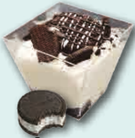
Crema con Galleta Oreo