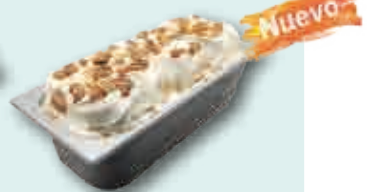
Dulce de Arce con nueces de Pecán