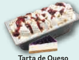
Tarta de Queso con Arándanos