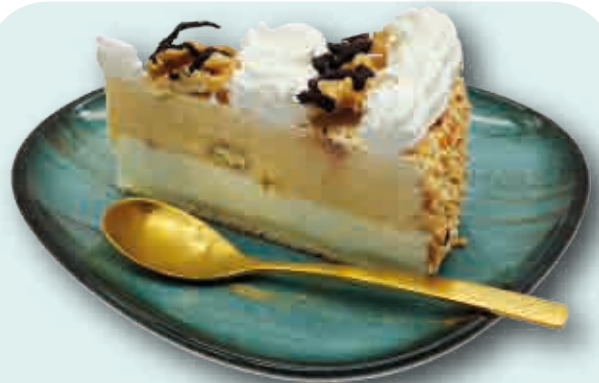
Tarta Nata Nueces con Toffee Porcionada Helado de nata, helado de nueces y nueces picadas 12 porciones/2100 ml.