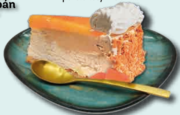
Tarta Yema al Whisky Porcionada Helado de nata, avellana y Yema al Whisky 12 porciones/2100 ml.