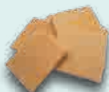
Galletas de corte

Tradicional Chocolate Crocanti chocolate blanco Crocanti chocolate