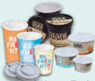
Vasos y Tarrinas de Papel