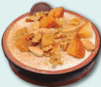
Gachas Caseras 170 ml. 6 unidades/caja