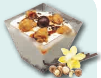
Vainilla Tahití con Nueces de Macadamia