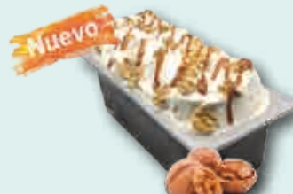
Nata Nueces con Toffee (Caramelo Salado)