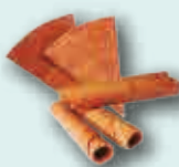
Abanicos Barquillos tubulares