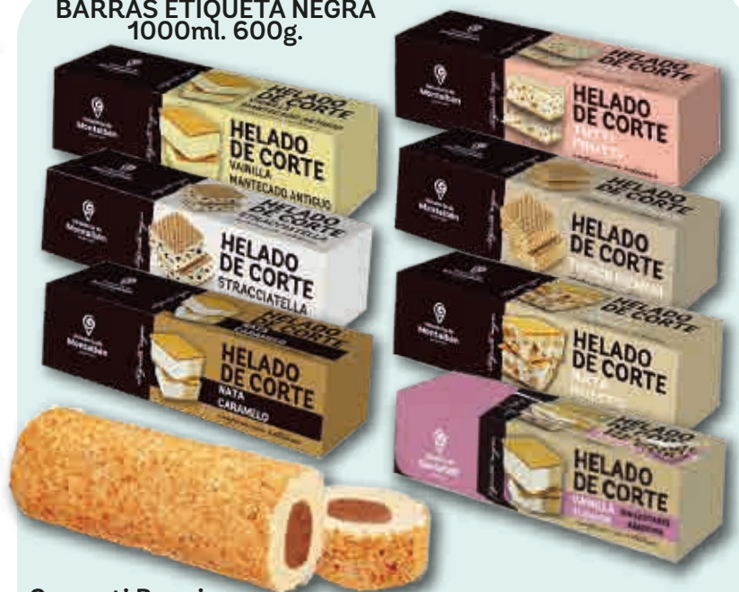
Crocanti Premium Vainilla-Turrón