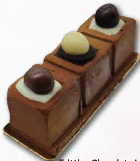
Trittico Chocolate Intenso Mousse de chocolate, con chocolate blanco y chocolate negro, decorado con bolas de cereal. 130 ml. 15 unidades/caja.