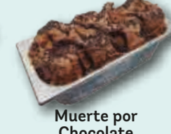
Muerte por Chocolate