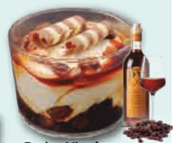
Pedro Ximénez con Pasas