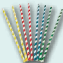
Pajita de Cartón