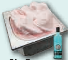
Gin Puerto de Indias