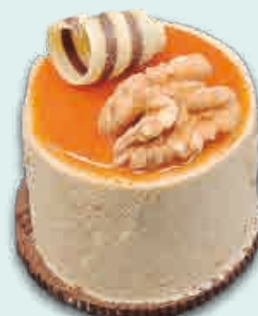
Nueces Delice Helado de nueces con corazón de caramelo y cubierta de dulce de leche. 125 ml. 15 unidades/caja.