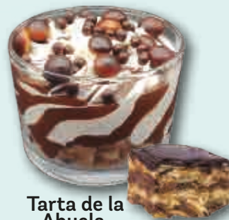
Tarta de la Abuela