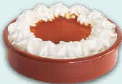
Tarta al Whisky 170 ml. 6 unidades/caja