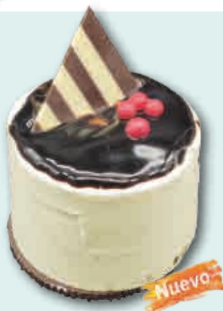
Piña Colada Delice Delicioso helado de piña colada con corazón de chocolate. 125 ml. 15 unidades/caja.