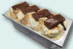
Tarta de la Abuela