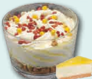
Tarta de Limón al Limoncello