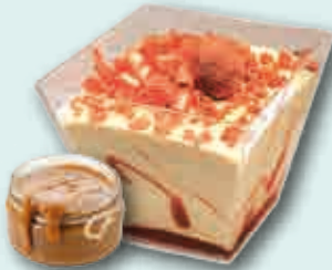
Dulce de Leche con Caramelo