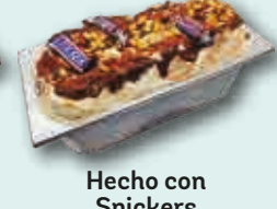
Hecho con Snickers