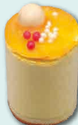
Delicia de Mango Exquisito helado de mango veteadado de chocolate. Decorado con mermelada de mango y bola de cereal. 140 ml. 20 unidades/caja.