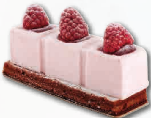
Lingote Yogurt con Frutos Rojos Bizcocho de chocolate, exquisito mousse de yogurt con frutos rojos, decorado con frambuesas. 130 ml. 15 unidades/caja.