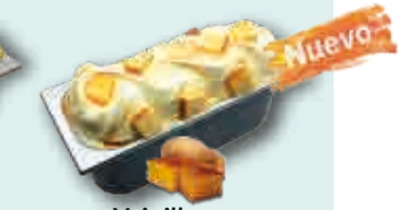
Vainilla con Tocino de Cielo