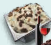
Pedro Ximénez con Pasas