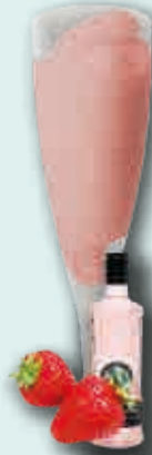
Gin Puerto de Indias