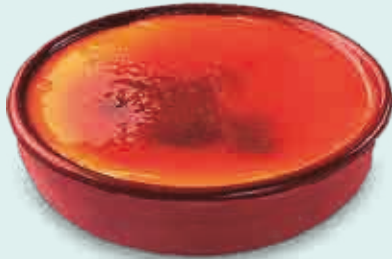
Crema Catalana 170 ml. 6 unidades/caja